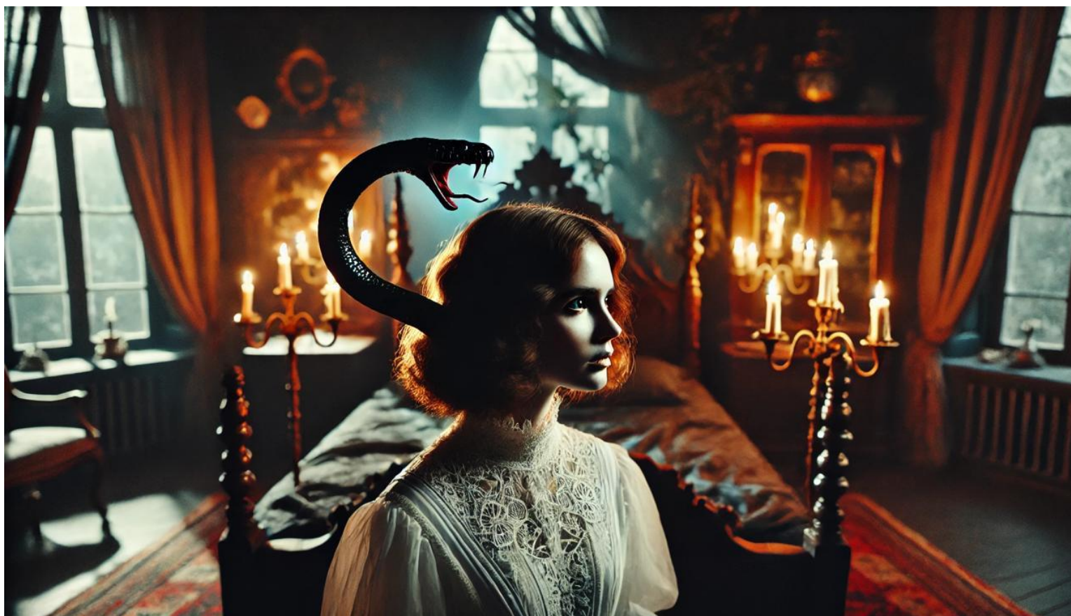
FEITIÇO DA SERPENTE