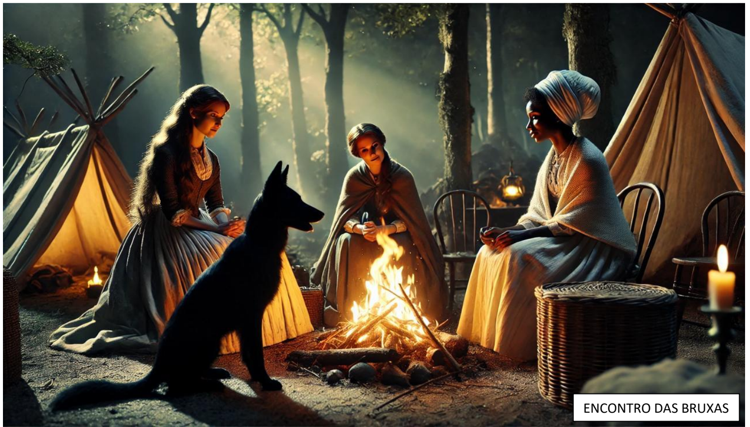
ENCONTRO DAS BRUXAS