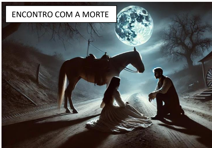
ENCONTRO COM A MORTE