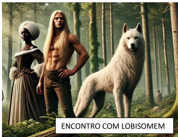
ENCONTRO COM LOBISOMEM