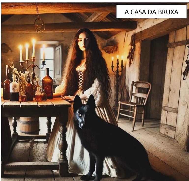
A CASA DA BRUXA