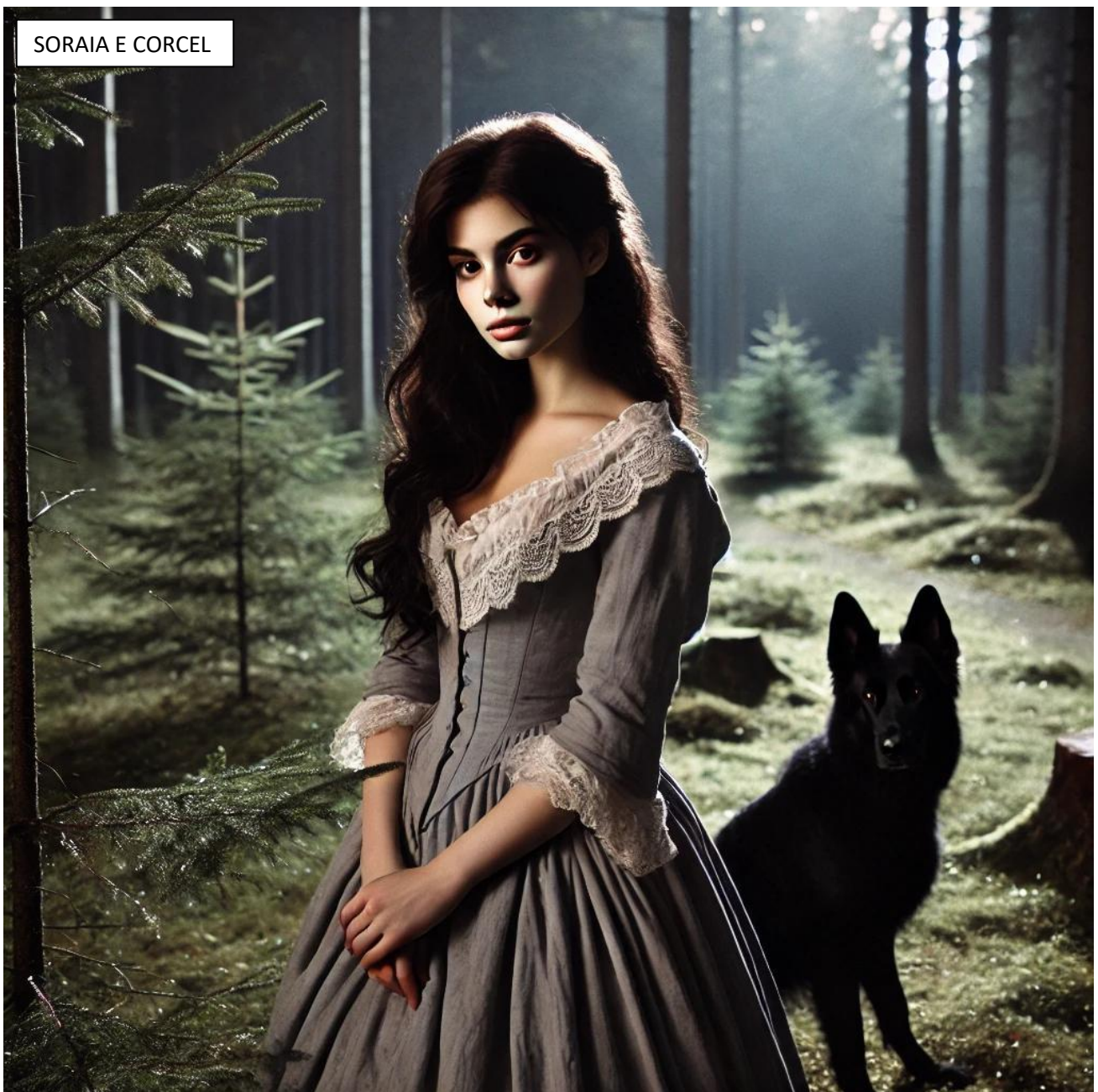
SORAIA E CORCEL