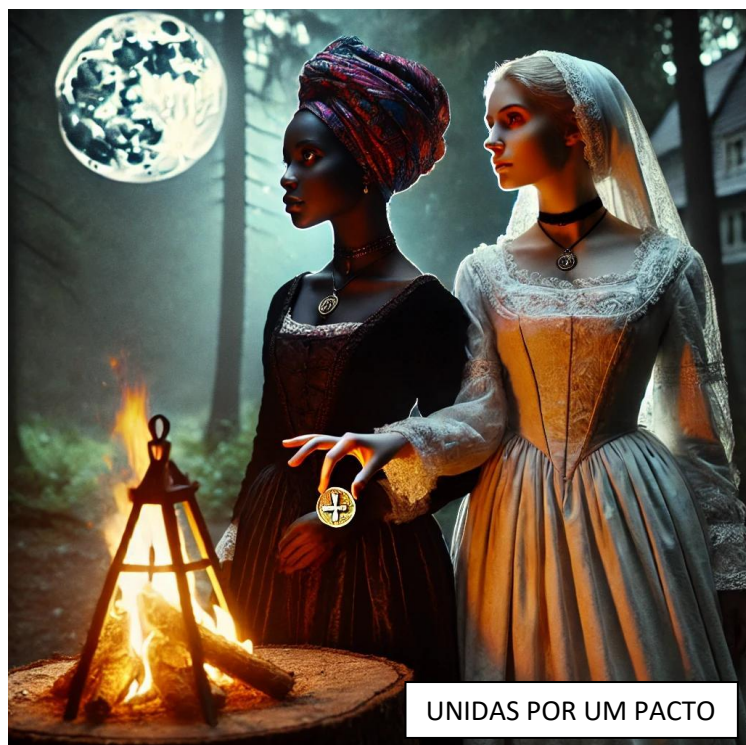
UNIDAS POR UM PACTO