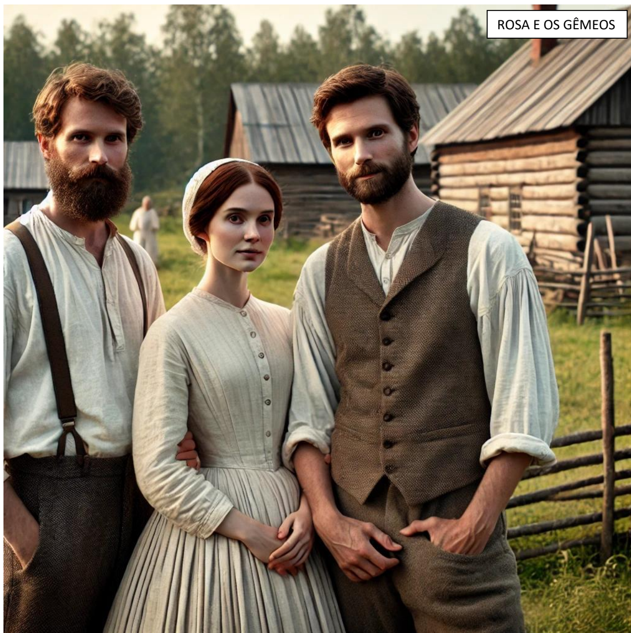
ROSA E OS GÊMEOS