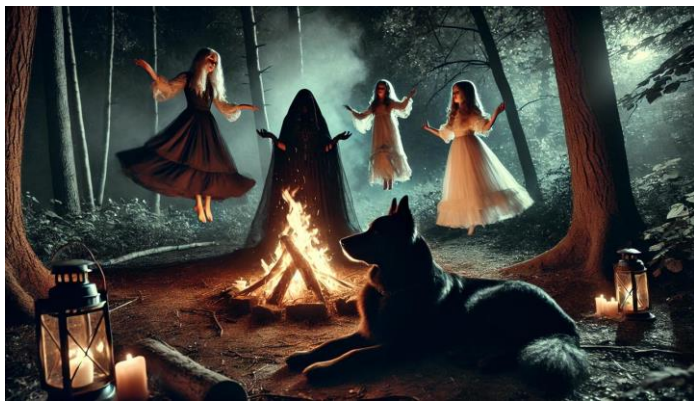
SACRIFÍCIO DAS ÓRFÃS